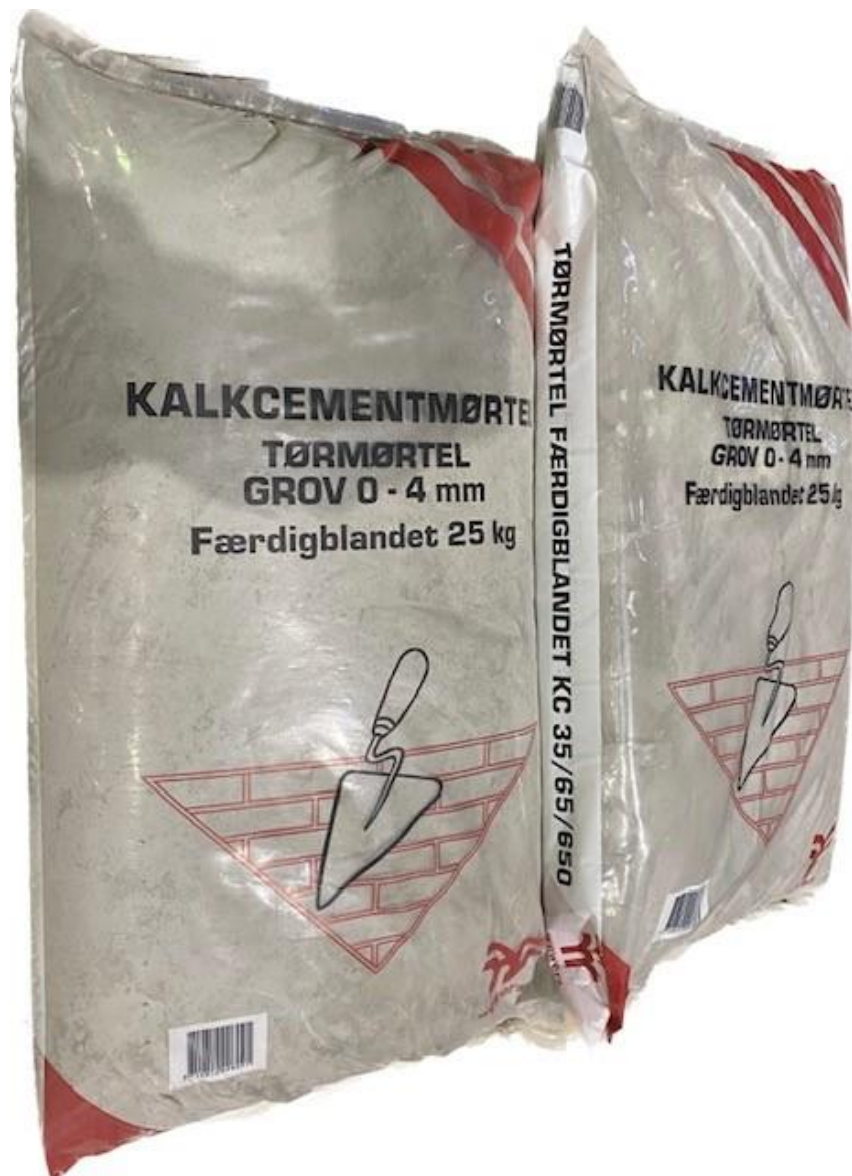
Figur 1 – Billeder af det færdigemballerede produkt.

Nedenfor på Figur 1 ses billeder af det deklarerede produkt.